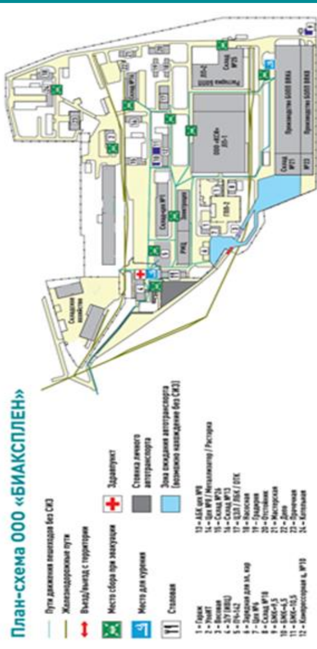
Схема территории предприятия ООО «БИАКСПЛЕН» Новокуйбышевский филиал