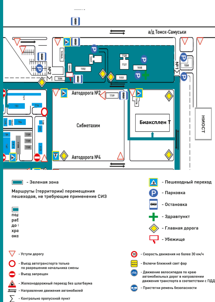
Схема передвижения ООО «БИАКСПЛЕН Т»

ООО «БИАКСПЛЕН» является ведущими производителями биаксиально-ориентированных полипропиленовых пленок, используемых для упаковки пищевых продуктов, средств гигиены, изделий текстильных и культурно-бытового назначения.